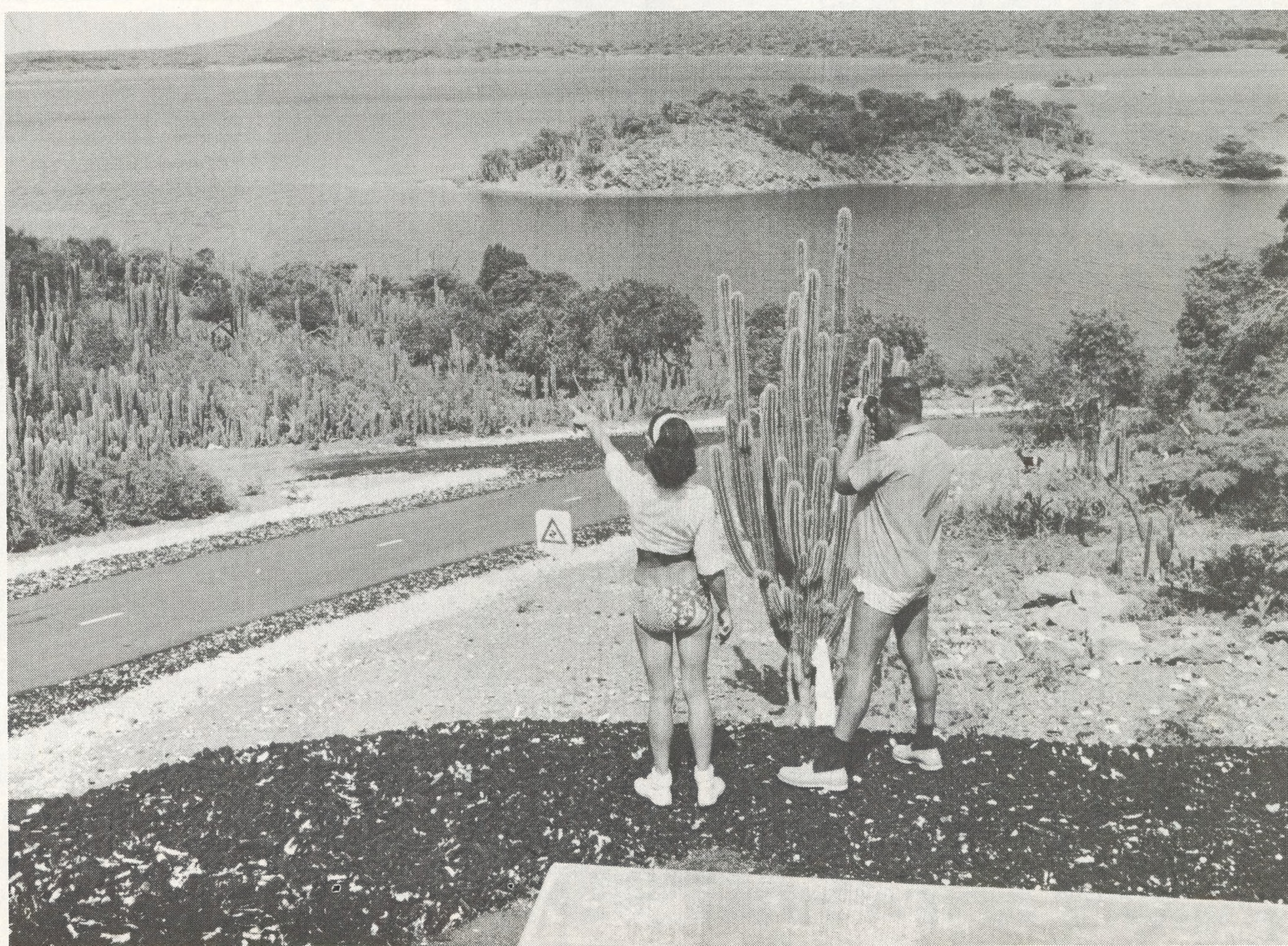
Aki nos lectornan por goza di un bunita bista riba "Goto-meer", tan afamá na Bonaire.